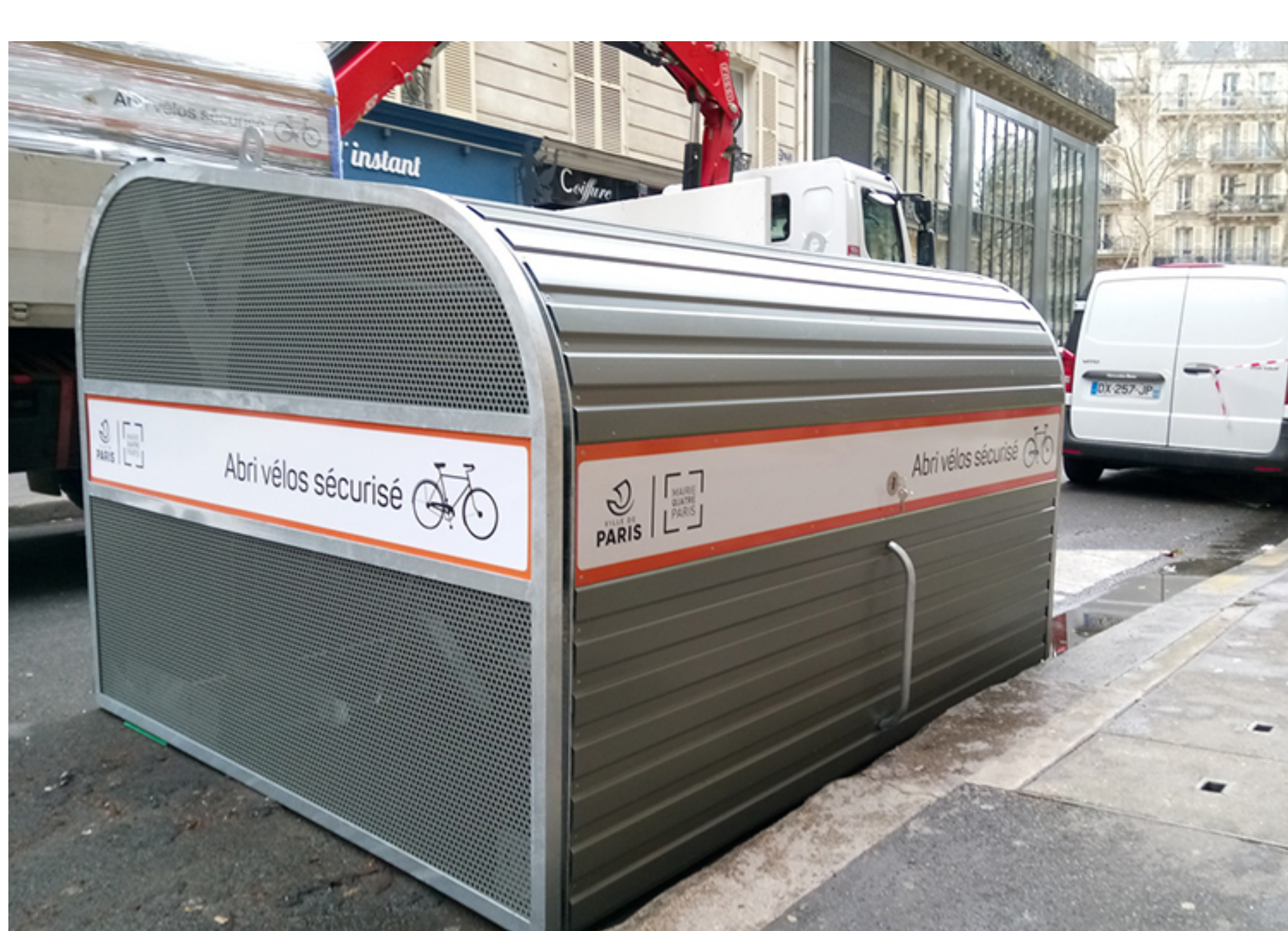
Box à vélos rue Jacques Cœur - Mairie de Paris 4è

Découvrez le fonctionnement de l'abri sur le site de la Ville de Paris : ici .