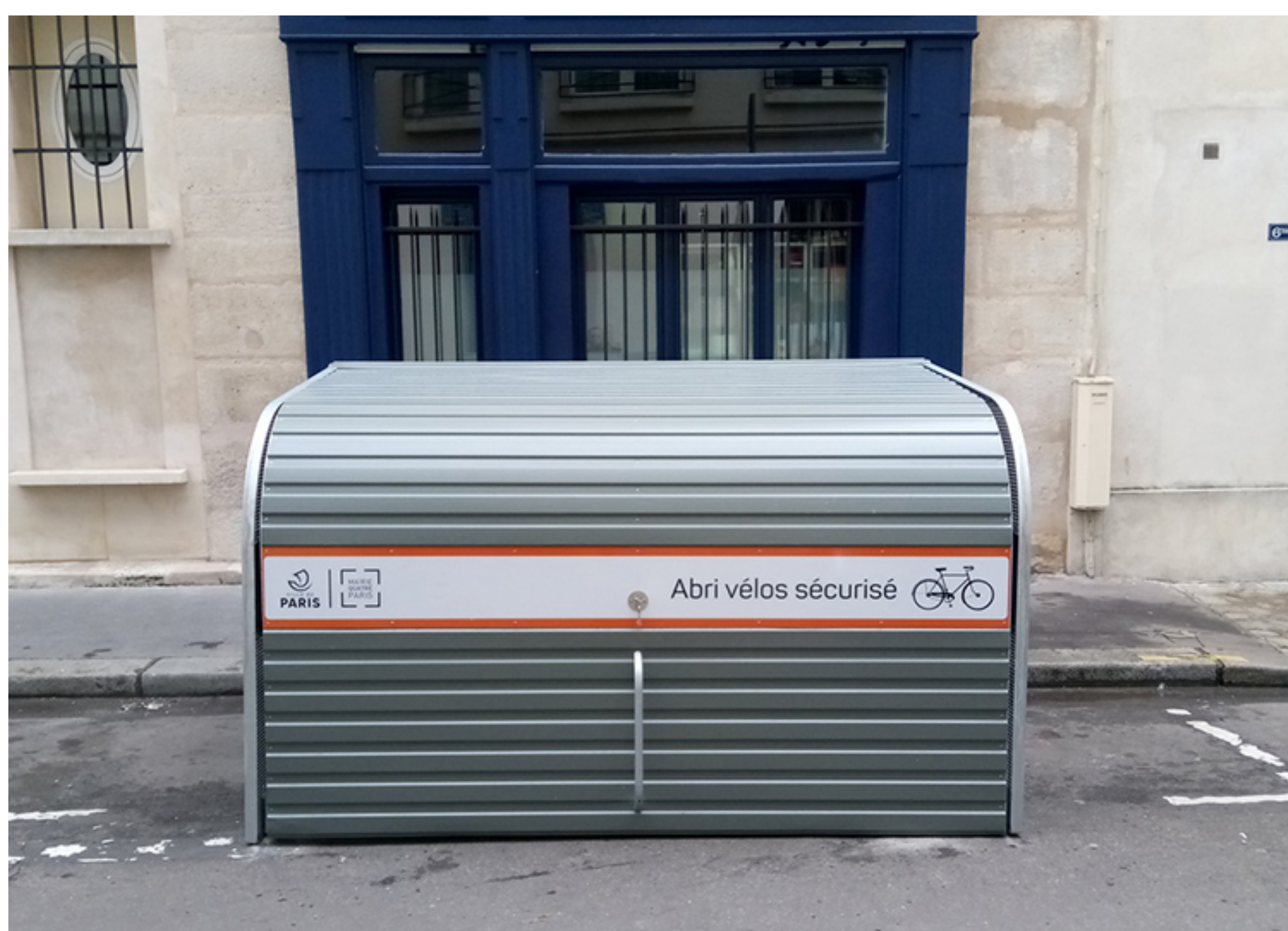
Des abris vélos pour les Parisiens dans le 4ème arrondissement de Paris

Cet accès sécurisé des box à vélos est prévu pour que seuls les habitants du quartier disposant de la clé puissent accéder à l'abri pour sécuriser leurs deux roues près de leurs résidences.