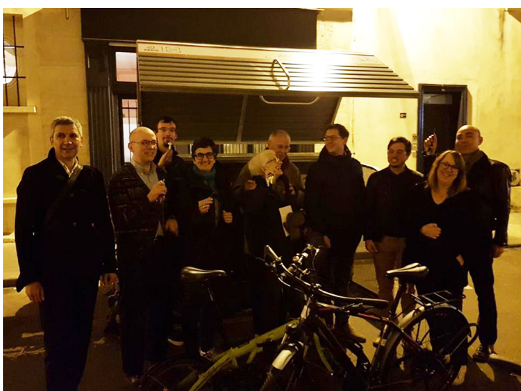
Inauguration des véloboxes le 21 mars, dans le 4ème arrondissement de Paris - Impasse Guéménée

Les box vélos Cooma ont été inaugurés ce jeudi 21 mars, en présence d'Ariel Weilt, le Maire du 4ème arrondissement de la Ville de Paris, à l'initiative de ces nouveaux aménagements vélos.