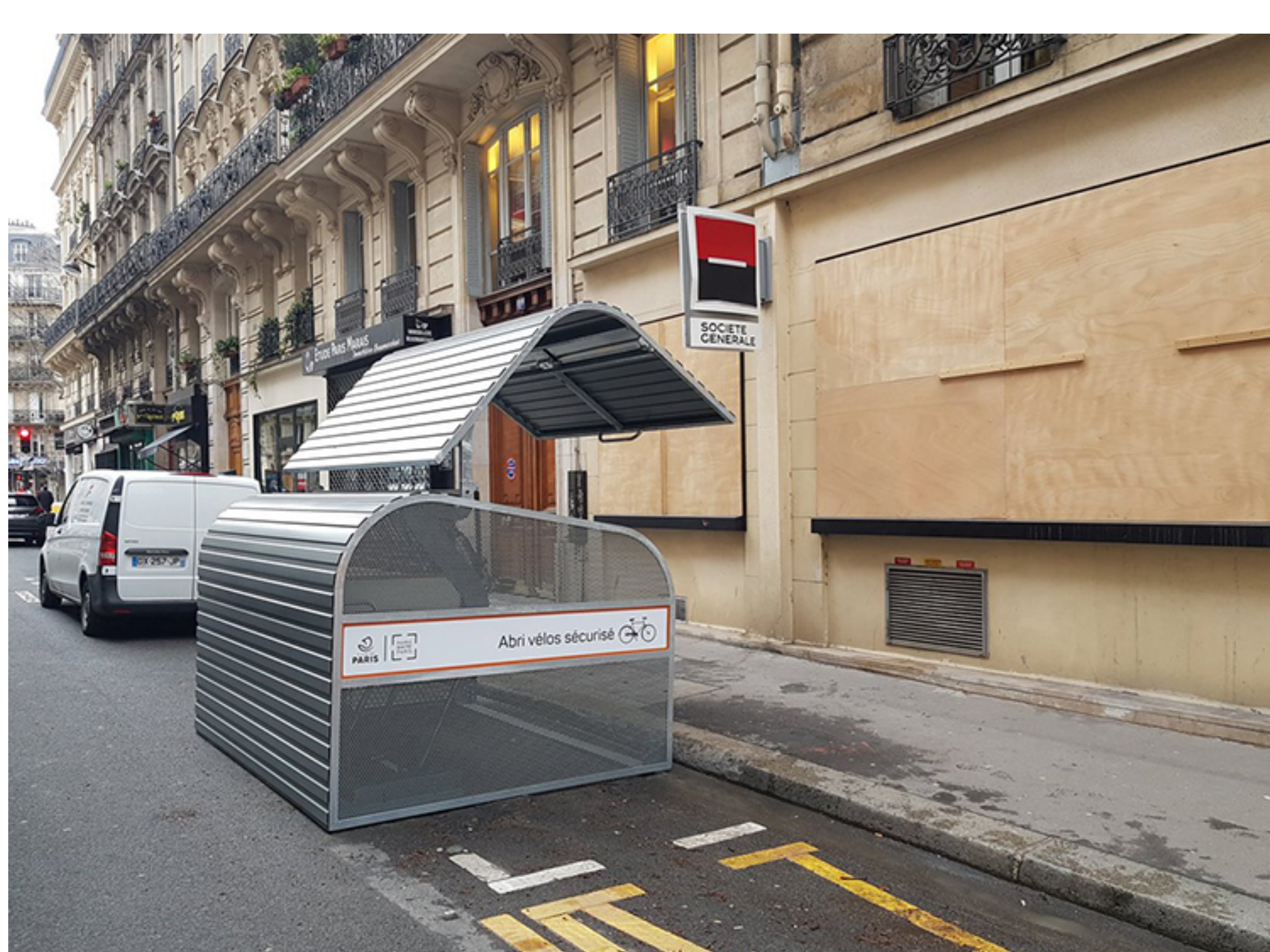
Ouverture de la porte de la consigne vélo sécurisée Cooma

Avec cette expérimentation, la capitale française met en marche son plan vélo national et cherche à rattraper son retard en matière de stationnement vélo pour proposer du stationnement vélo résidentiel et sécurisé aux Parisiens, à l'instar de Bruxelles ou Londres.