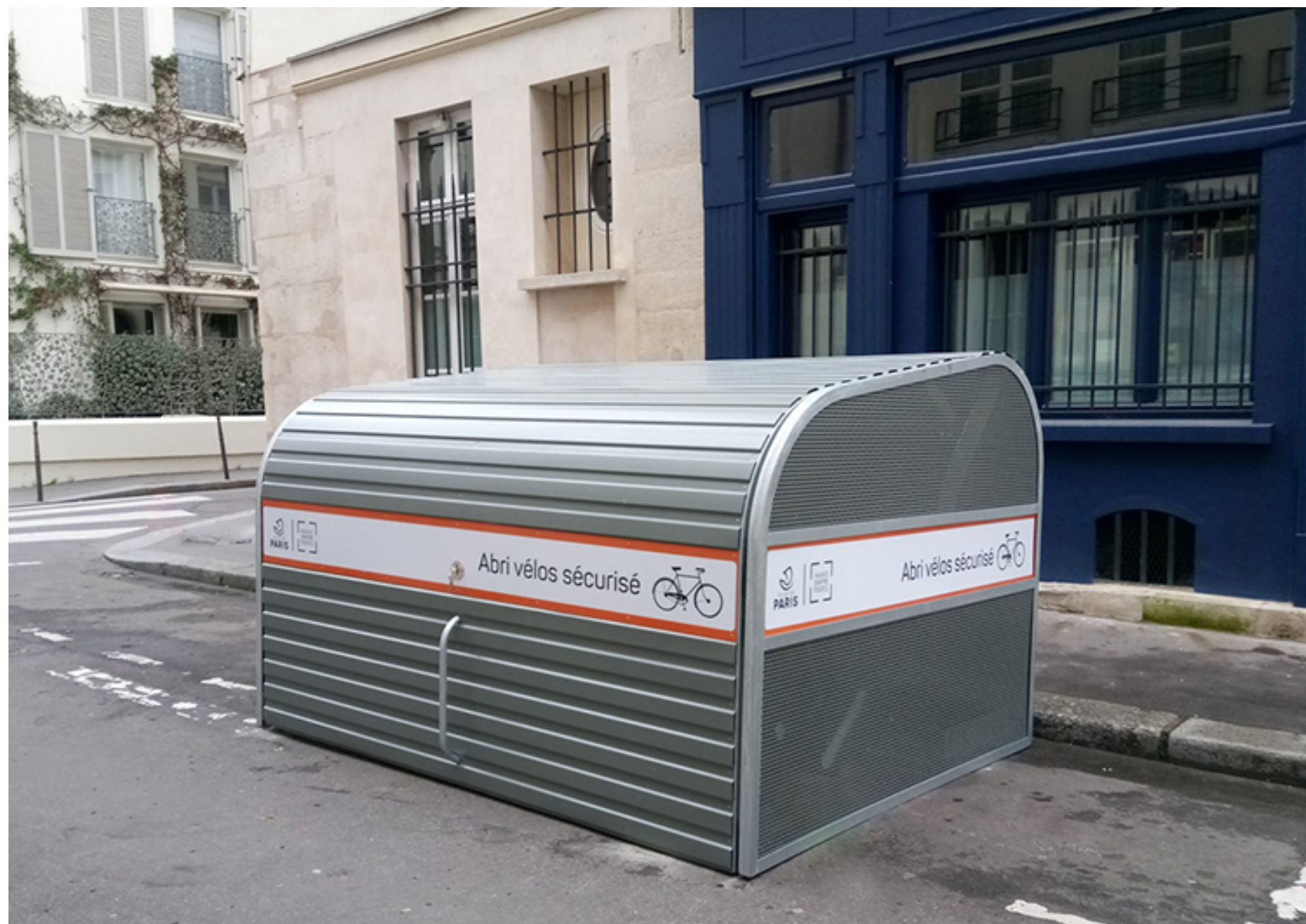
Abri vélos sécurisé modèle Cooma - Mairie Quatre Paris

2 vélos box modèle Cooma ont été installés la semaine dernière dans le quatrième arrondissement de Paris (75004) dans l'impasse Guéménée et rue Jacques Cœur.